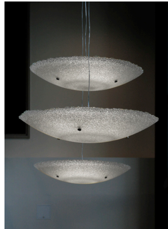
Lahden tiede- ja yrityspuiston pääaulan valaisimet