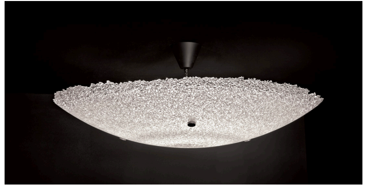
Sirua-valaisin 90 cm

Tutustu muihin tuotteisiin osoitteessa www.essis.fi