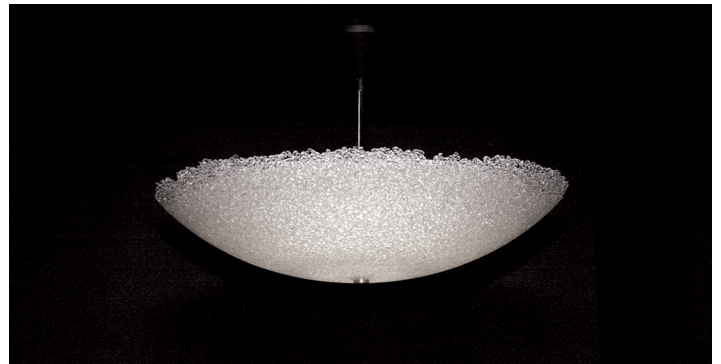
Sirua-valaisin 60 cm